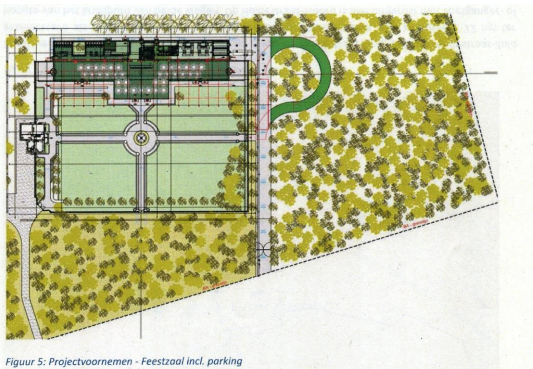
Figuur 5: Projectvoornemen - Feestzaal incl. parking

Onderstaande figuren geven een 3D-zicht op de gerenoveerde orangerie.